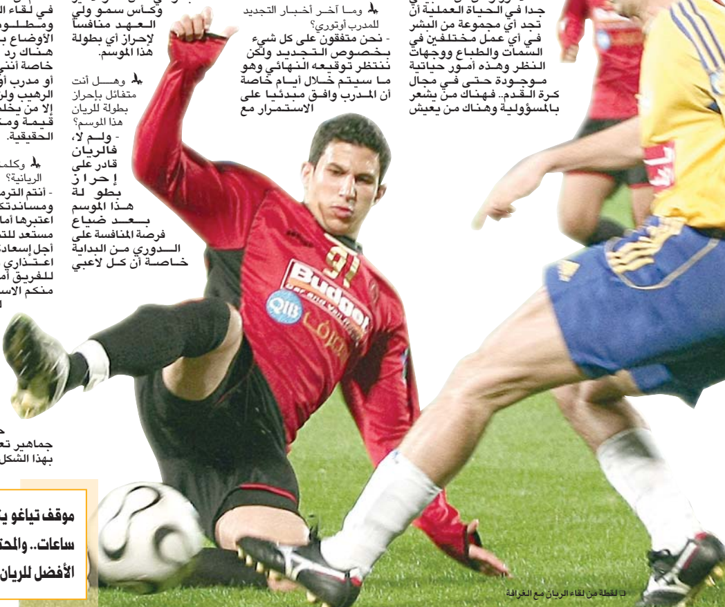
لقطة من لقاء الريان مع الغرافة

- دعنا نترك التفاصيل في مثل هذه الأمور ولكن من الطبيعي جدا في الحياة العملية أن تجد أي مجموعة من البشر في أي عمل مختلفين في السمات والطباع ووجهات النظر وهذه أمور حياتية موجودة حتى في مجال كرة القدم.. فهناك من يشعر بالمسؤولية وهناك من يعيش